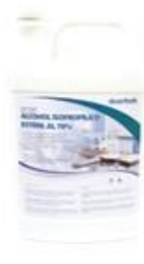
Empaquetado Botella de galón