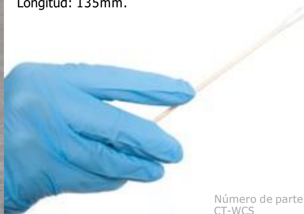
Número de parte CT-WCS